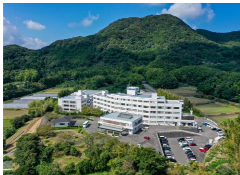
【病院は自然に囲まれています】