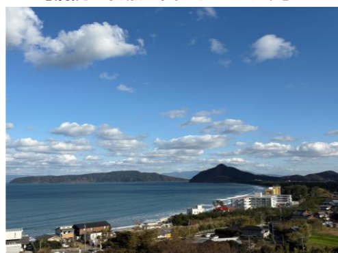
【病院正面に広がる博多湾】