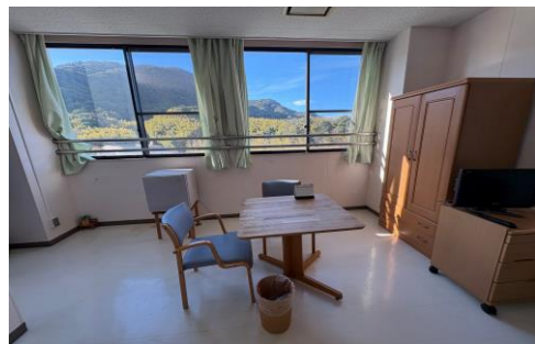
【有料個室1,000円/日 2室】 【有料個室2,000円/日 6室】