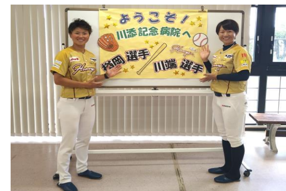
【選手が当院のリハビリへ参加】