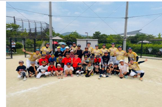
【親子野球フェスタの様子】