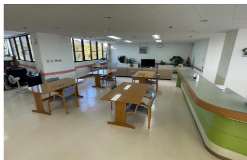
【クリアな病棟フロア】